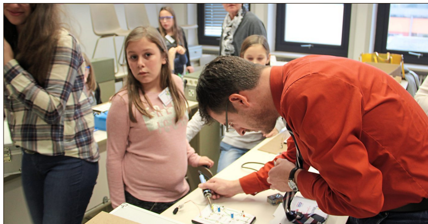
Hier lötet der Chef.